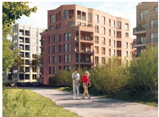
Nextensa - Tour & Taxis - Park Lane

In juli 2022 werd de reeds eerder aangekondigde verkoop van Anima (AvH 91,8%) aan AG afgerond. Deze transactie heeft AvH meer dan 300 miljoen euro cash opgebracht en een meerwaarde van ruim 235 miljoen euro. AvH is bijzonder trots om samen met de medewerkers van Anima en het managementteam helemaal vanuit het niets op 15 jaar tijd een kwaliteitsvolle en gerespecteerde uitbater van woonzorgcentra in België met 2.710 'bedden' te hebben uitgebouwd.