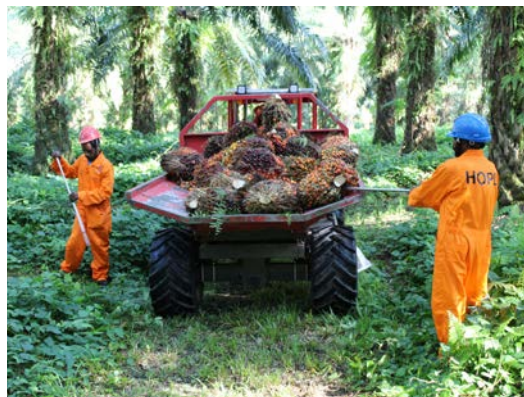
Hargy Oil Palms - Papoea-Nieuw-Guinea

AvH heeft in de loop van het derde kwartaal haar deelneming in SIPEF verhoogd van 35,94% tot 36,36%.