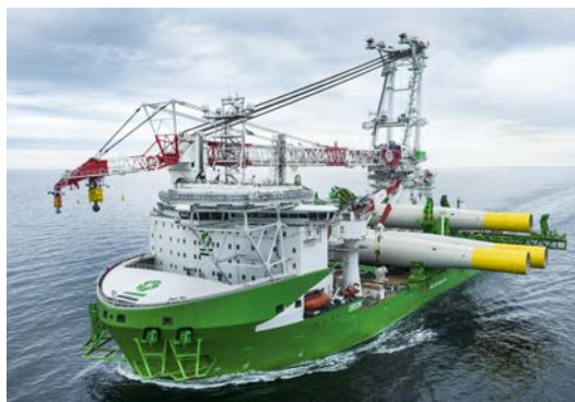
DEME - Orion - Arcadis Ost 1

DEME blijft op koers om haar vooruitzichten voor het volledige jaar 2022 te realiseren: een licht hogere omzet dan in 2021, een EBITDA vergelijkbaar met 2021 en een iets lager nettoresultaat. Verwacht wordt dat de investeringen voor het volledige boekjaar 2022 ongeveer 500 miljoen euro zullen bedragen.