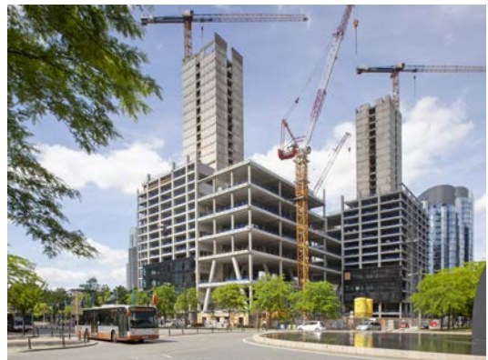
CFE - ZIN Brussel

Bij Green Offshore (AvH 81,06%) produceerden de windparken SeaMade en Rentel samen meer dan 1.600 GWh groene stroom over de eerste 9 maanden van 2022. De windomstandigheden waren deze zomer niet optimaal, met lagere windsnelheden dan verwacht.